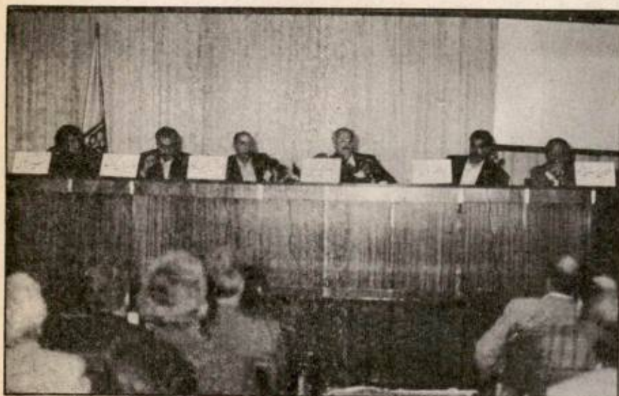
بحث گروهی مدیران شرکت بوتان و شرکت صنعتی بوتان

سیستمهای کامپیوتری طراحی شده توسط واحد کامپیوتر همکاری نمی‌کردند و افزودند در واقع یک نرم‌افزار خوب و یک طراحی خوب برای موفقیت کافی نیست بلکه کاربران باید در استقرار سیستم مشارکت داشته باشند. وی دلیل مهم دیگری برای استقرار سیستمهای کامپیوتری را حمایت مدیریت شرکت توصیف کردند. ایشان اشاره کردند که بازرگاری فعالیتهای شرکت با نگرش فرایندی و تعریف فرایندها از ابتدا تا انتها باعث شد که بین کارشناسان مختلف شرکت اعم از حسابدار، متخصص فنی یا کارشناس کامپیوتر تفاهم و درک یکسانی از کلیت شرکت پدید آید که به همکاری مشترک آنان در ایجاد و بهره‌برداری از سیستمها منجر گردید.