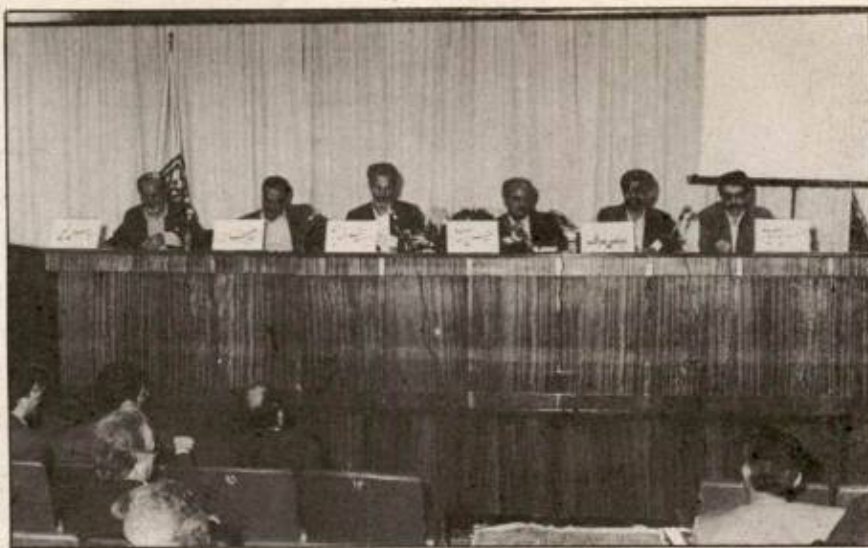
بحث گروهی مدیران شرکت سیمان فارس و خوزستان

ایشان در توضیحات خود به گزارشهای نقدینگی و نحوه تنظیم دخل و خرج واحدها، گزارشهای پیشفروش محصولات و برنامه‌ریزی تولید واحدها، اطلاعات مقدراری و رسالی فروش و برنامه‌ریزی فروش نیز اشاره کردند.