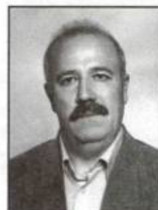
۳۱۷۵- کریم نهم شرکت طراحی مهندسی و ساخت تجهیزات و ابزارآلات سایا