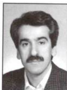
۳۳۵۰ - فریدون حسینیانی وزارت امور اقتصادی و دارایی