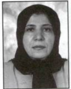
صغری شهراسی حسابرسی آریا حسابرسان پارسا