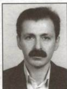
۳۶۰۶- ایرج پروانه سازمان حسابرسی