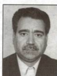
۳۵۸۷- یوسف مدیری مدیریت آماد نیروی هوایی جمهوری اسلامی ایران