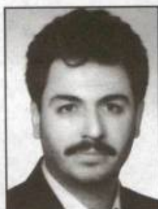
۳۶۰۰- سیدپایک خلفی شرکت تحقیق و تولید وسایل الکترونیک (تکتا)