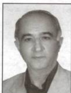
۳۵۷۳ - سید محمود تقوی دیوان محاسبات کشور