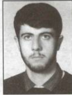
۳۵۷۹- ابراهیم سورسوری وزارت جهاد کشاورزی