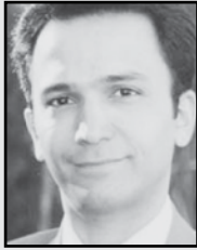
مترجم: محسن قاسمی