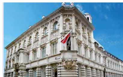
تالار حسابداران خبره (دفتر مرکزی انجمن حسابداران خبره‌ی انگلستان و ولز) نماد حسابداری بریتانیا، و از آخرین بناهای دوران ویکتوریایی لندن

فعالیت‌های این انجمن به‌عنوان یکی از قدیمی‌ترین انجمن‌های حرفه‌ای حسابداری بریتانیا و جهان تنها محدود به مرزهای جزیره نیست؛ به طوری که نزدیک به ۱۵,۰۰۰ تن از اعضای آن بیرون از بریتانیا زندگی و کار می‌کنند. همچنین، در چند سال گذشته برای پشتیبانی از اعضای انجمن در آسیا افزون بر دو دفتر انجمن در بریتانیا سه دفتر دیگر آن نیز در سنگاپور (۲۰۰۹)، دبی (۲۰۰۹)، و پکن (۲۰۱۱) راه‌اندازی شده است.