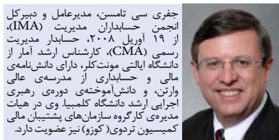
جفری سی تامسن، مدیرعامل و دبیرکل انجمن حسابداران مدیریت (IMA)، از ۱۹ آوریل ۲۰۰۸، حسابدار مدیریت رسمی (CMA)، کارشناس ارشد آمار از دانشگاه ایالتی مونت‌کلر، دارای دانش‌نامه‌ی مالی و حسابداری از مدرسه‌ی عالی وارتن، و دانش‌آموخته‌ی دوره‌ی رهبری اجرایی ارشد دانشگاه کلمبیا وی در هیات مدیره‌ی کارگروه سازمان‌های پشتیبان مالی کمیسیون تزدوی (کوزو) نیز عضویت دارد.

این انجمن نزدیک به ۹۳ سال پیش با نام "انجمن ملی حسابداران بها (NACA)" در بافالوی نیویورک، با هدف ترویج دانش و حرفه‌ای‌گرایی بین حسابداران بها و پرورش شناخت گسترده از نقش حسابداری بها در مدیریت راه‌اندازی شد. نام آن، ابتدا به "انجمن ملی حسابداران (NAA)" و سرانجام- در ۱۹۹۱- به "انجمن حسابداران مدیریت (IMA)" تغییر یافت. رسالت این انجمن، فراهم آوردن محفلی برای پژوهش، توسعه‌ی روش‌های اجرایی، آموزش، به‌اشتراک‌گذاری دانش، و هواداری از اخلاق و به‌روش‌های تجاری در حسابداری مدیریت است.