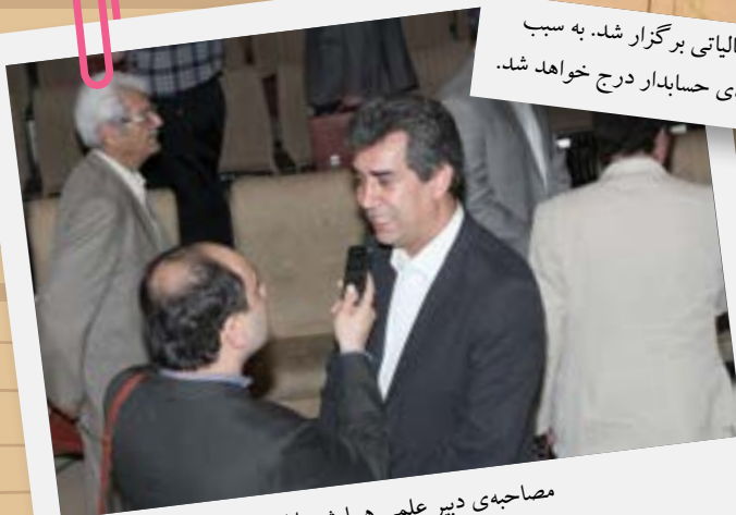
مصاحبه‌ی دبیر علمی همایش با ایرنا