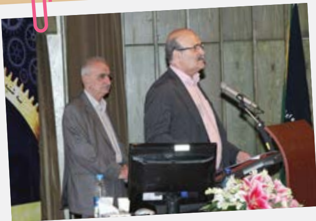
سخنرانی غلامرضا سلامی در تقدیر از محمد تقی نژاد عمران

رحمت‌اله صادقیان رئیس شورای عالی انجمن حسابداران خبره‌ی ایران