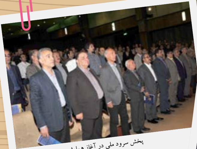
بخش سرود ملی در آغاز همایش