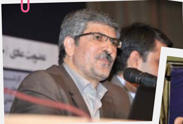
محمد قاسم پناهی قائم مقام سازمان امور مالیاتی در حال پاسخ گویی به پرسش‌ها