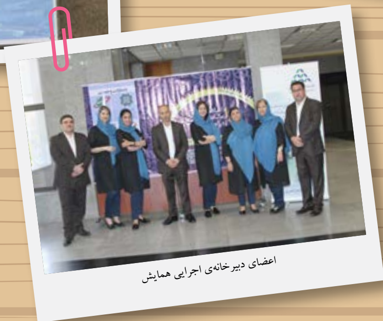
اعضای دبیرخانه‌ی اجرایی همایش