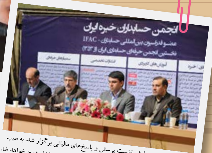
در بخش پایانی همایش نشست پرسش و پاسخ‌های مالیاتی برگزار شد. به سبب اهمیت مطالب طرح شده مشروح آن در شماره‌ی آینده‌ی حسابدار درج خواهد شد.