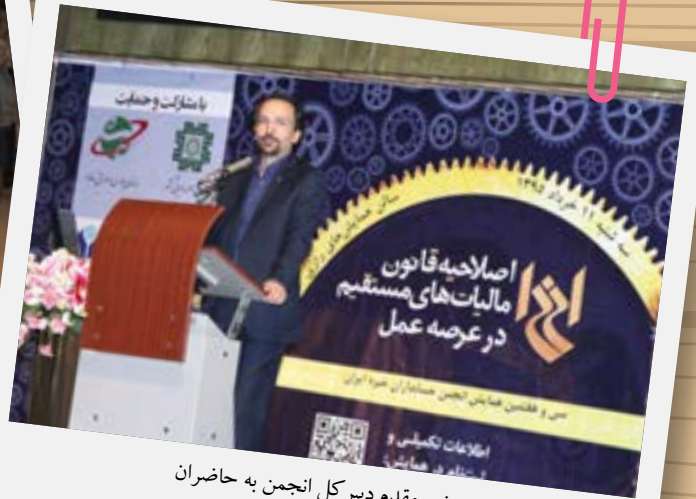
خیر مقدم دبیر کل انجمن به حضاران