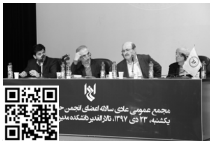
برای دیدن ویدئو کد بالا را اسکن کنید

شرکت‌های نرم‌افزاری آرین سیستم، الگوریتم پویا و طرح‌اندیشان پویا از برگزاری این گردهمایی حمایت مالی کردند و در نمایشگاه جنبی آن به معرفی محصولات و راهکارهای نرم‌افزاری خود پرداختند.