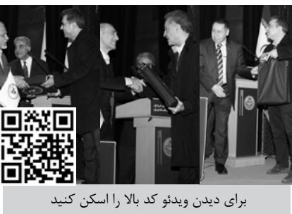
برای دیدن ویدئو کد بالا را اسکن کنید