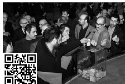
برای دیدن ویدئو کد بالا را اسکن کنید