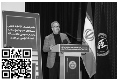
برای دیدن ویدئو کد بالا را اسکن کنید