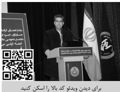
برای دیدن ویدئو کد بالا را اسکن کنید

اطلاعات و دنیای اقتصاد به عنوان روزنامه‌های کثیرالانتشار برای انتشار آگهی‌های انجمن تعیین شدند.